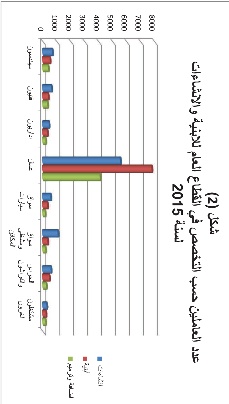
شكل (2) عدد العاملين حسب التخصص في القطاع العام للأبنية والإنشاءات لسنة 2015